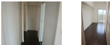
【バス停】西原入口／徒歩約1分