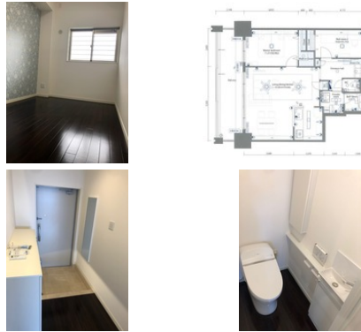
【バス停】真栄原／徒歩約1分