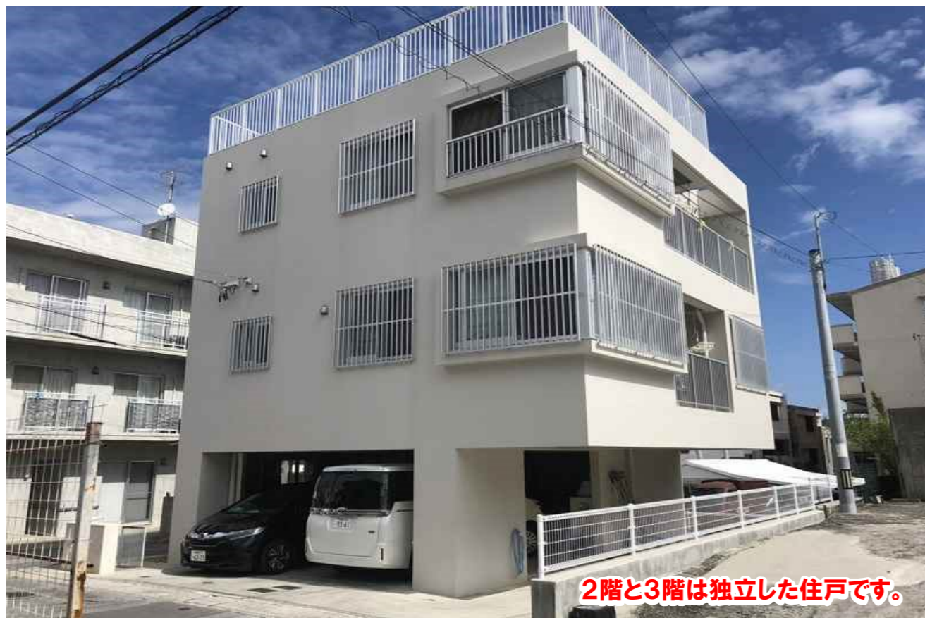
2階と3階は独立した住戸です。